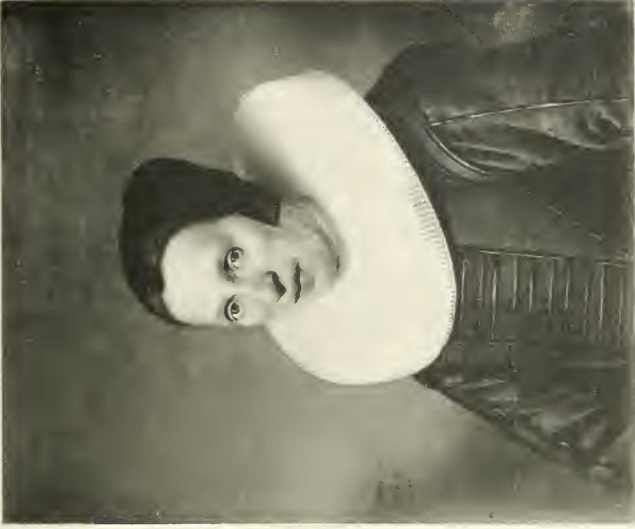
J. Gz. CUYYP